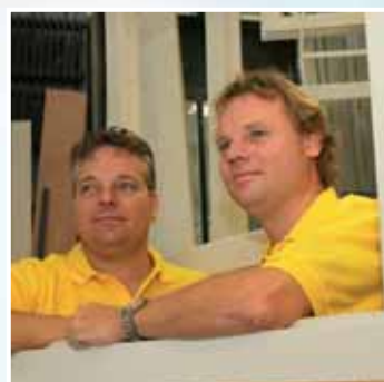
Veertig jaar vakmanschap in hout