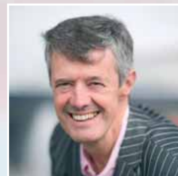
De accountant als ideale klokkenluider